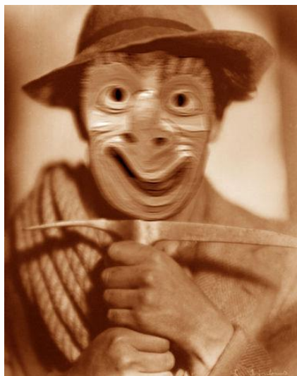
Luis „Hudel“ Trenker im SW-Film „D'Buschl ruft“

Turnusgemäß besuchen wir alle 2 Jahre die Zünfte unserer Landschaft-Oberschwaben-Allgäu, so auch die Dorauszunft aus Bad Saulgau am Fasnetdienstag 2011. Traditionell findet der Umzug in Saulgau schon am Vormittag um 10.30 Uhr statt. Um die Teilnahme am Saulgauer Narrensprung attraktiver zu gestalten, werden wir die Busfahrt zu einem „Schnäppchenpreis“ von einem Euro (!) anbieten. Dies umfasst auch die Weiterfahrt zum Narrensprung in Ehingen einschließlich der Rückfahrt.